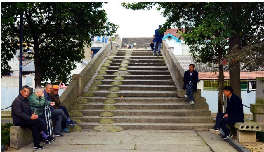
图 11 融入百姓生活的武胜桥