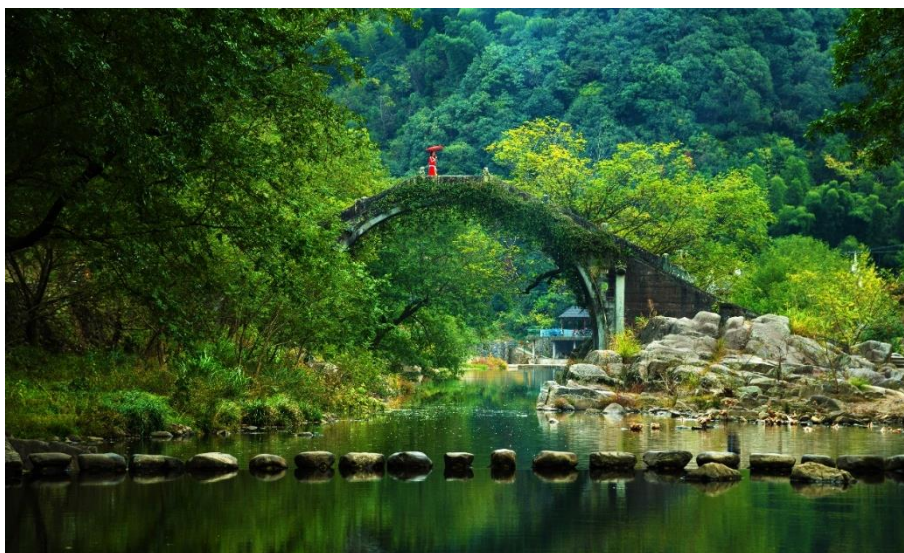
图 12 碧水青山白云桥

白云桥位于余姚城南四明山麓的鹿亭乡中村，初建于唐·贞观年间，以后历有毁建，现桥重建于清光绪十六年（1890）。据《光绪余姚县志》载：“白云桥在中邨，唐·贞观间建，下临石门潭，鄞、余分界处。”