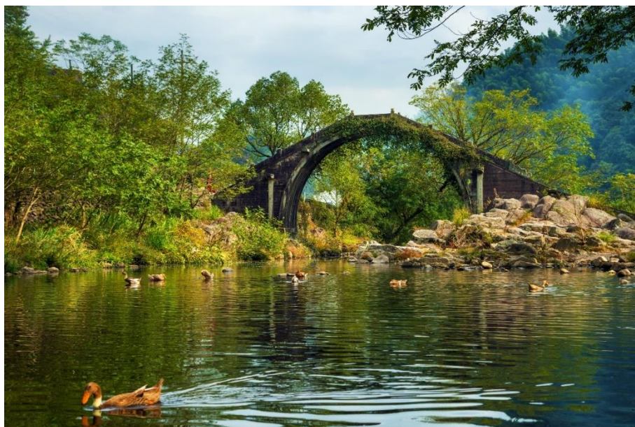
图 13 白云桥

关于白云桥所处鹿亭乡地名之缘由，明末清初·黄宗羲《四明山志》云，南朝著名隐士孔祐曾隐居在这里，有鹿中箭来投于祐，祐为之养伤，鹿伤愈后离去，于是在此建亭，名“鹿亭”。明·沈明臣作《鹿亭诗》：“孔祐今何处，空山有鹿亭。路生迷宿草，天远落寒星。春雨茸茸绿，烟峰漠漠青。放麋嗟往事，深竹故啼猩。”白云桥临近的中村，历史可追溯千年，青山环绕，绿水蜿蜒，古宅深巷，犹如世外桃源。