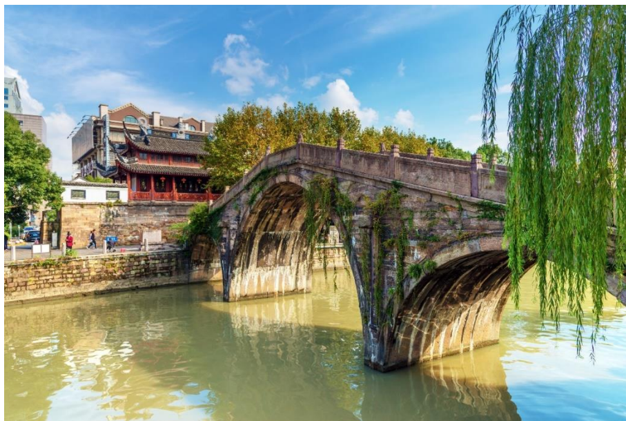
图5 通济桥与舜江楼

通济桥所跨姚江，是浙东运河中的自然河段，曾经是漕粮海运的重要河道。桥西不远处有座青秀的小山，名龙泉山，山不在高，明代心学宗师王阳明曾于此讲学。立于桥头江畔，但见水光山影，飞虹名楼，景色格外旖旎。