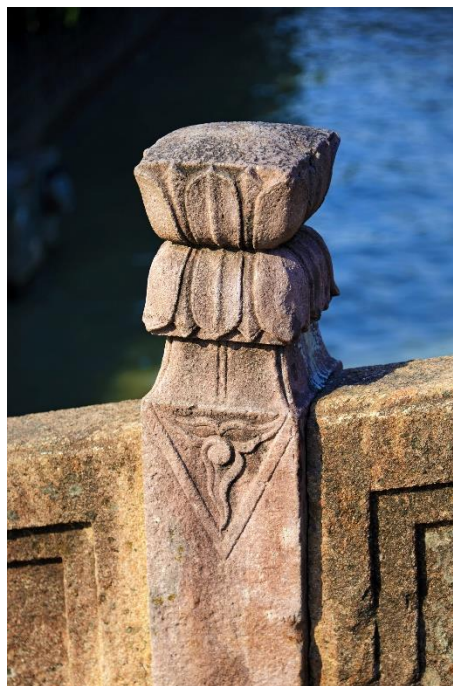
图 4 通济桥望柱

通济桥于 1981 年 6 月被公布为余姚市重点文物保护单位。2011 年 1 月被公布为第六批省级文物保护单位。2019 年 10 月被公布为第八批全国重点文物保护单位。