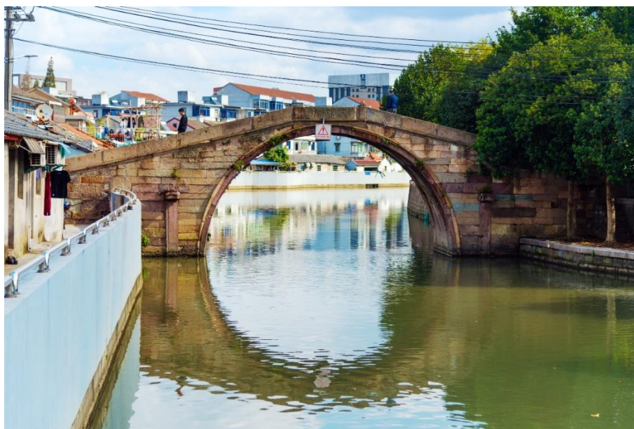
图 10 武胜桥

武胜门是余姚古城北城的北大门，是余姚古城北部的要塞。武胜门外曾建有瓮城，瓮城外的候青江上则建有武胜桥，具有我国传统城垣防御体系的典型特征。