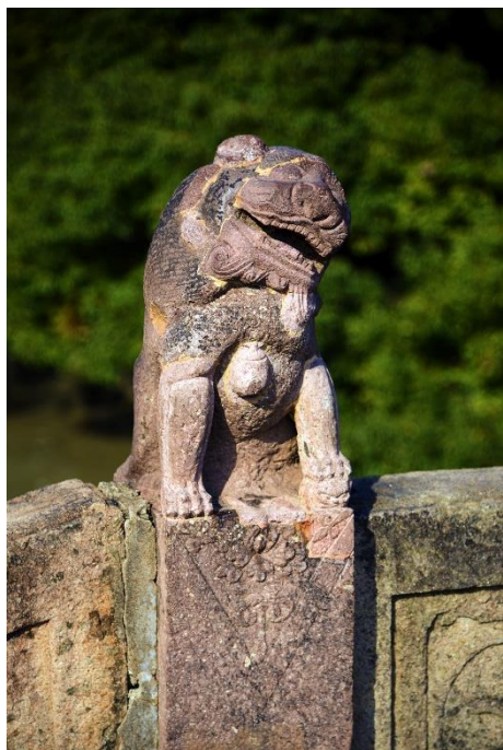
图 3 通济桥望柱

全桥共有望柱 24 根，桥顶 4 根的柱头雕有石狮，形态生动，精致秀丽，其余柱头则雕刻各式仰俯莲装饰造型。桥顶栏板内侧还刻有浮雕花纹，气韵生动，线条流畅。中孔两侧的侧墙上各有一根桥联柱，柱上镌有楹联，东面为：“千里遥吞沧海月，万年独抵大江浪。”西面为：“一曲蕙兰飞彩鹞，双城烟雨卧长虹。”